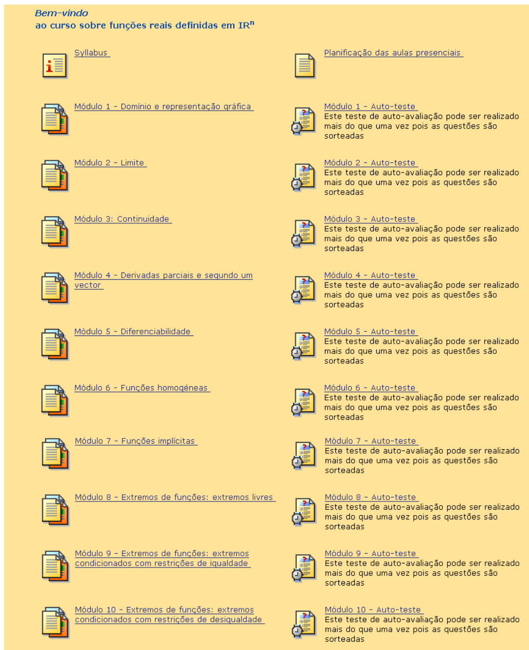
Figura 2. Screen shot do conteúdo do curso

Na Figura 2. detalha-se a pasta “Conteúdo do curso” que, mantendo a modularidade, se decompõe em 4 partes. O “Syllabus” onde o aluno pode apreender os objectivos da disciplina, entender o seu funcionamento, a bibliografia e o regime de avaliação, entre outros. A “Planificação das aulas presenciais” permite aos alunos um conhecimento prévio, desde o primeiro dia de aulas, sobre o calendário e sumários das aulas presenciais bem como dos dias das provas intercalares. O curso é composto por 10 módulos sendo cada um acompanhado de um teste de auto-avaliação sem qualquer controle de classificação por parte da equipa docente. Este teste pode ser repetido várias vezes na medida em que por cada realização são sorteadas um conjunto de questões de uma base de dados de perguntas, permitindo assim um leque diverso de testes diferentes.